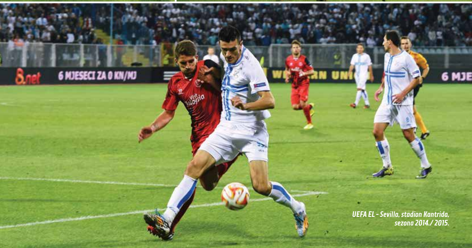
UEFA EL - Sevilla, stadion Kantrida, sezona 2014./2015.