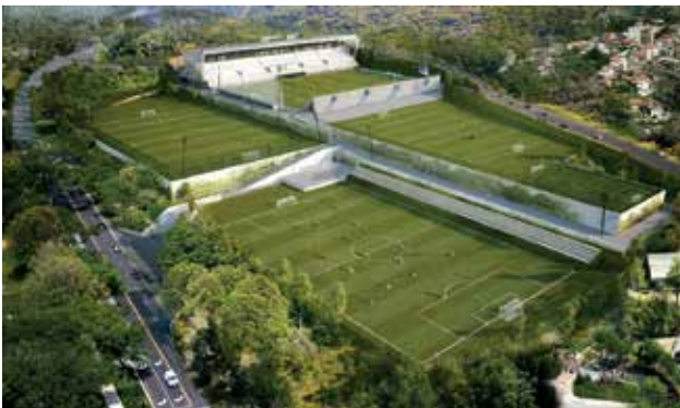
Trening kamp i Stadion HNK Rijeka, projekcija 27. 11. 2014. g.