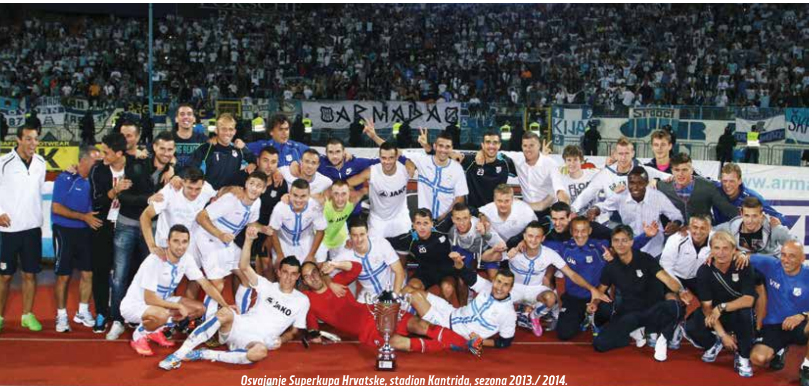
Osvajanje Superkupa Hrvatske, stadion Kantrida, sezona 2013./2014.