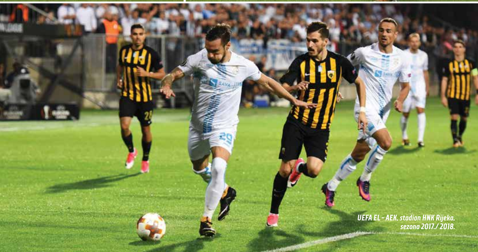
UEFA EL - AEK, stadion HNK Rijeka, sezona 2017./2018.