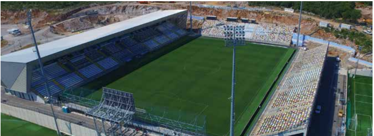
Izgrađena sjeverna tribina 15. 07. 2017. g.