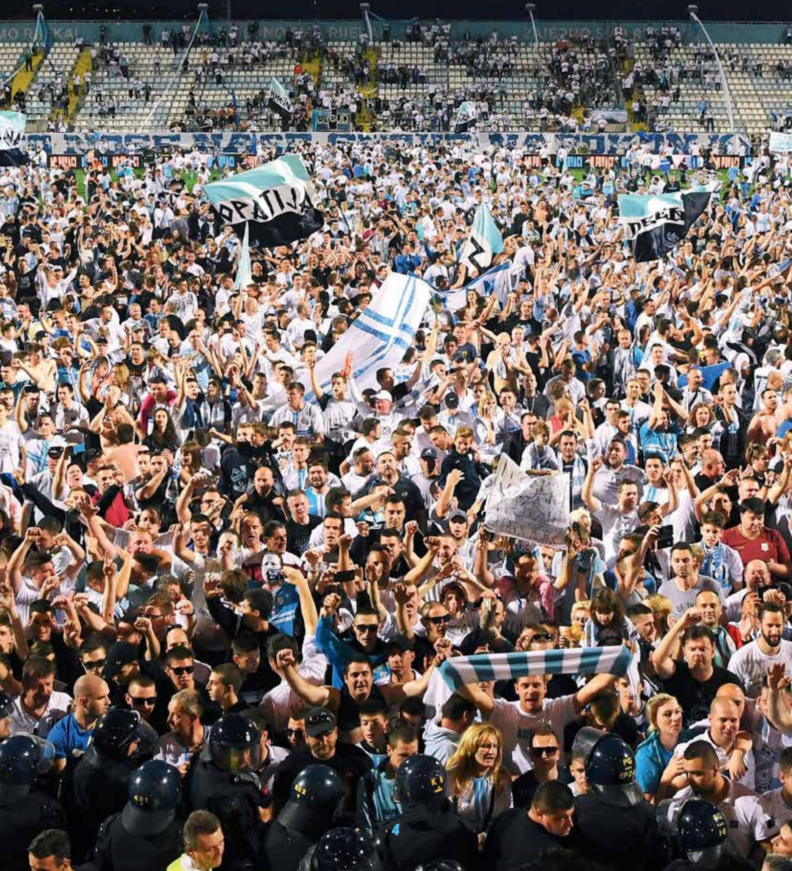
Proslava naslova prvaka Hrvatske, stadion HNK Rijeka, sezona 2016./2017.