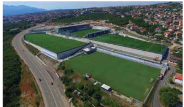
Stvarno stanje 4. 10. 2015. g.