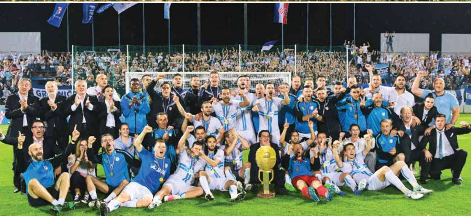
Osvajanje Kupa Hrvatske, stadion Anđelko Herjavec, sezona 2016./2017.