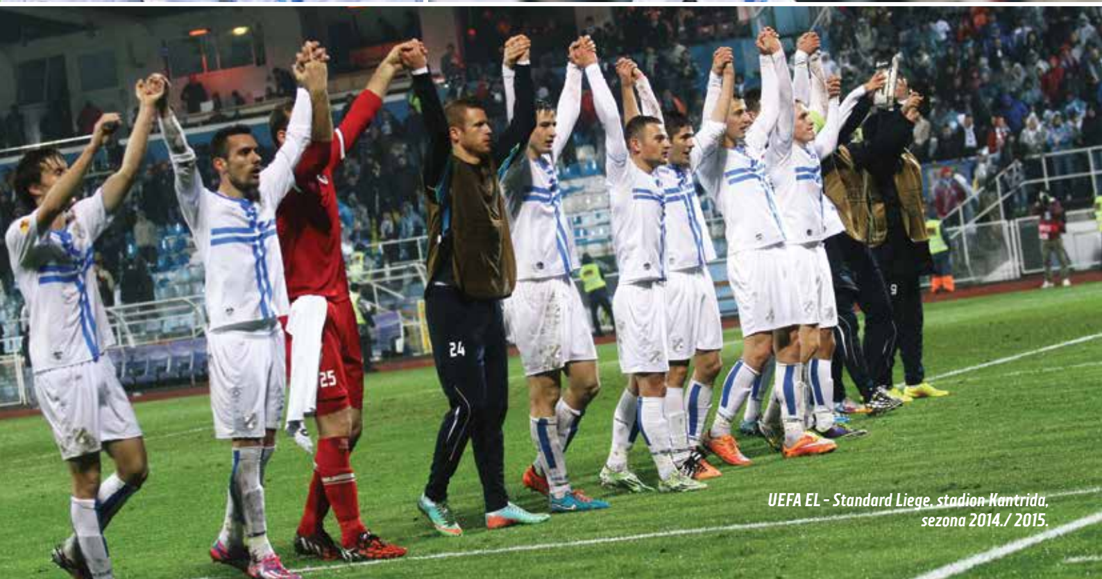
UEFA EL - Standard Liege, stadion Wantrida, sezona 2014./2015.