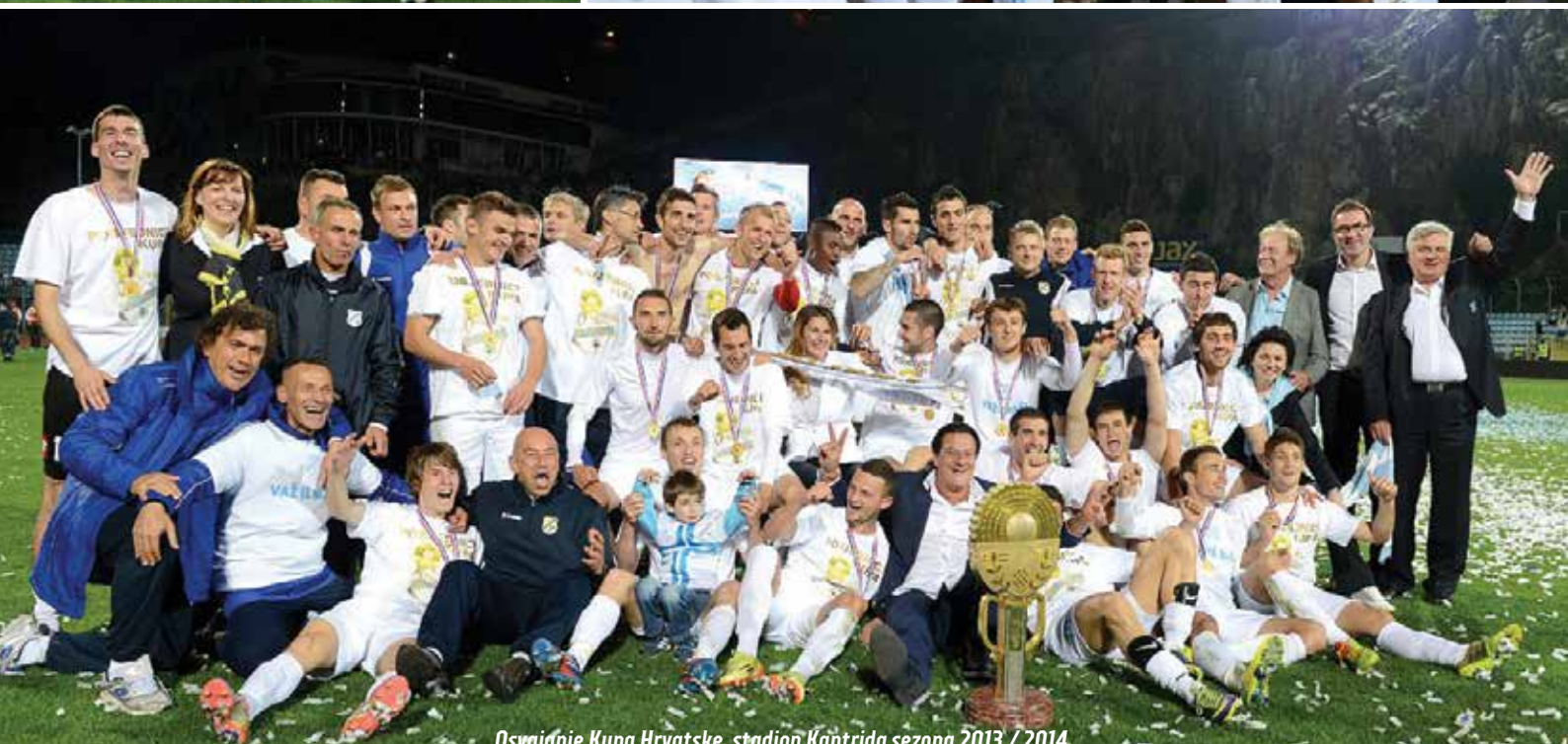
Osvajanje Kupa Hrvatske, stadion Kantrida sezona 2013./2014.