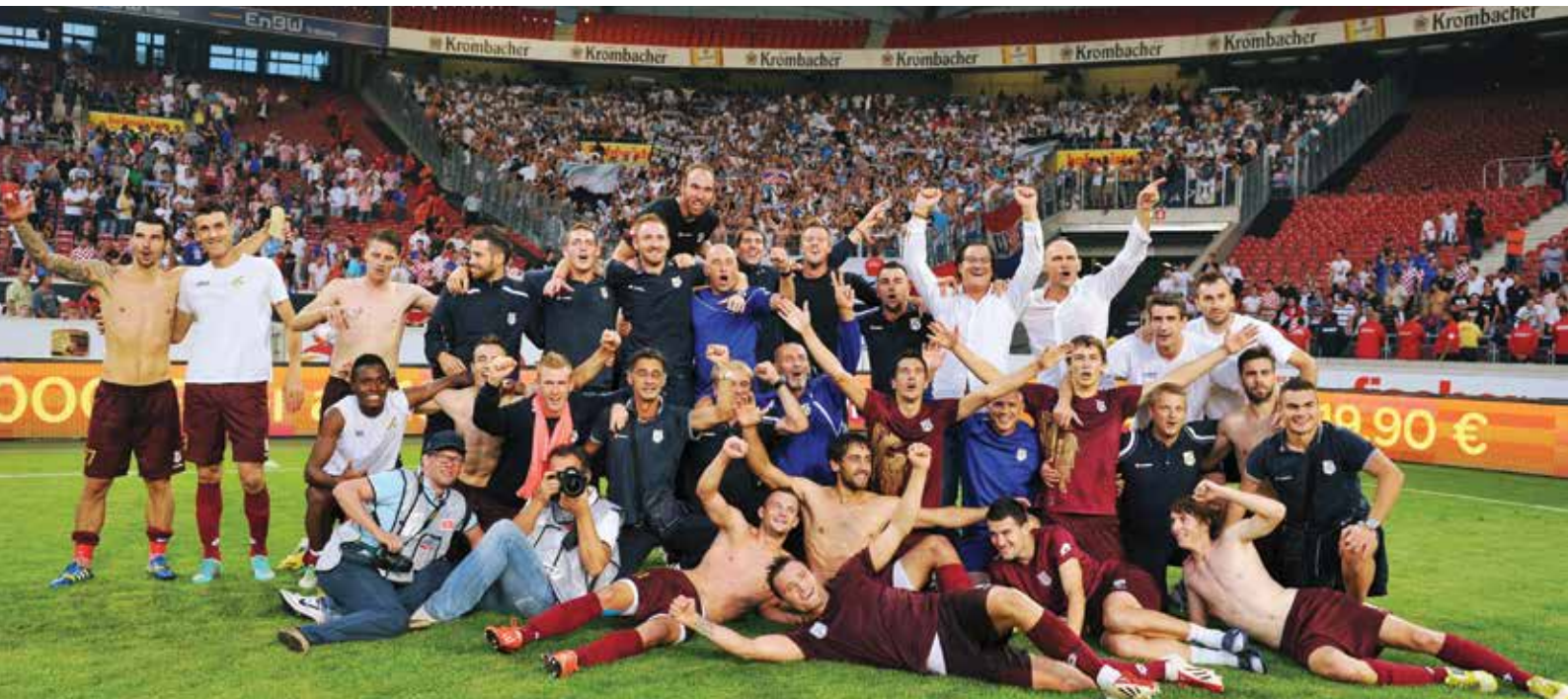
Play-off UEFA EL - Stuttgart, stadion Kantrida / Mercedes Benz Arena, sezona 2013 / 2014.