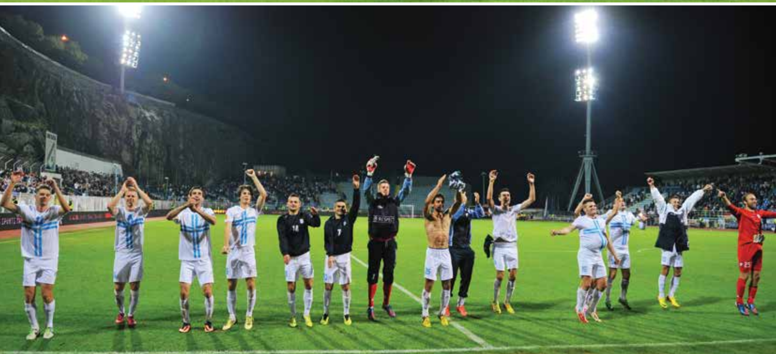
UEFA EL - Real Betis, stadion Kantrida, sezona 2013./2014.