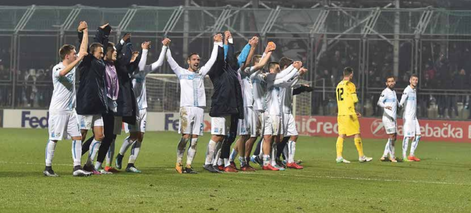
UEFA EL - Milan, stadion HNK Rijeka, sezona 2017./2018.