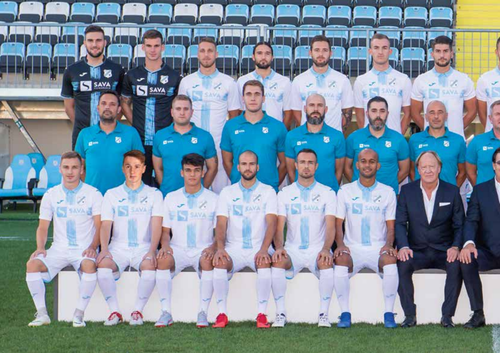
HNK Rijeka, sezona 2018./2019.