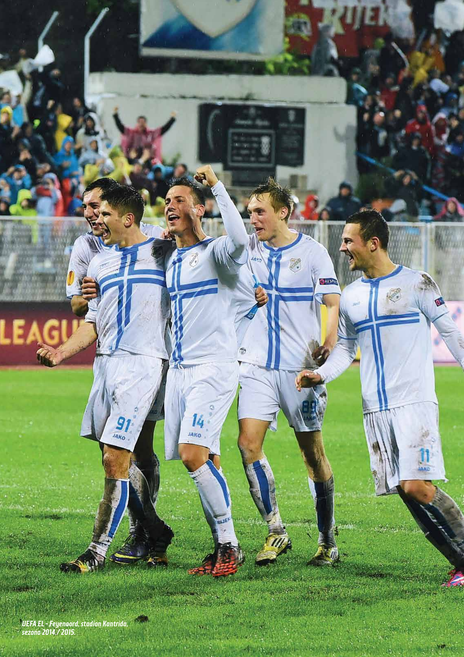
UEFA EL - Feyenoord, stadion Kantrida, sezona 2014./2015.